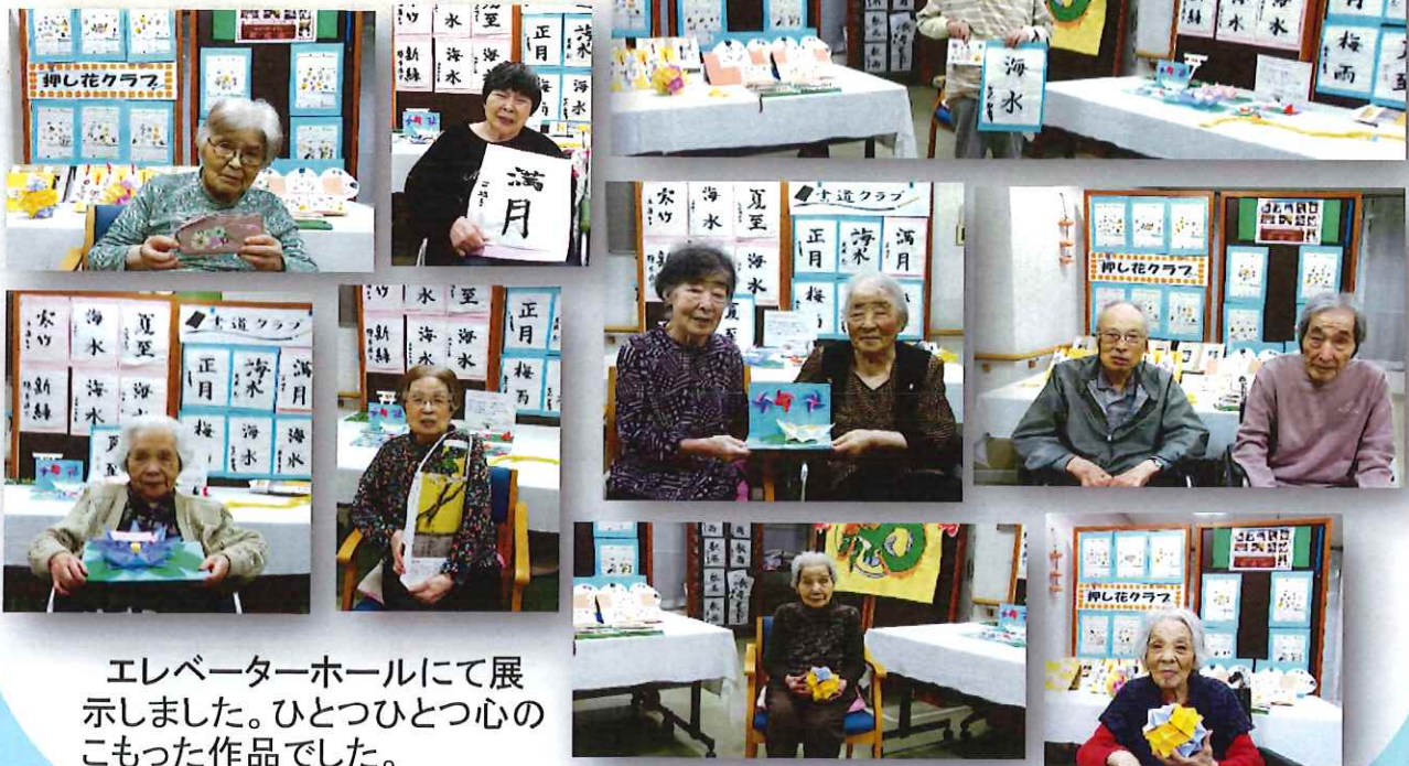
エレベーターホールにて展示しました。ひとつひとつのこもった作品でした。